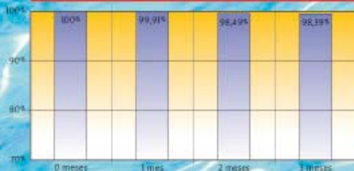
Estabilidad de DOXI-10 PREMIX en pienso en harina